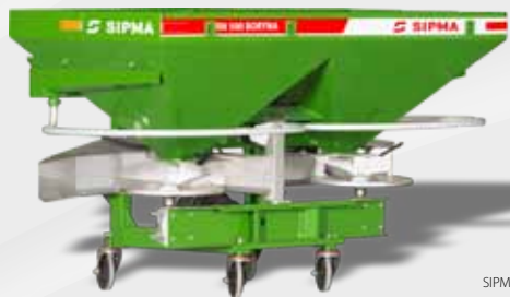
SIPMA RN 500 BORYNA

Les distributeurs d'engrais minéraux SIPMA RN 610 ANTEK et SIPMA RN 500 BORYNA sont des machines faciles à utiliser et économiques, conçus pour les petites et moyennes exploitations.