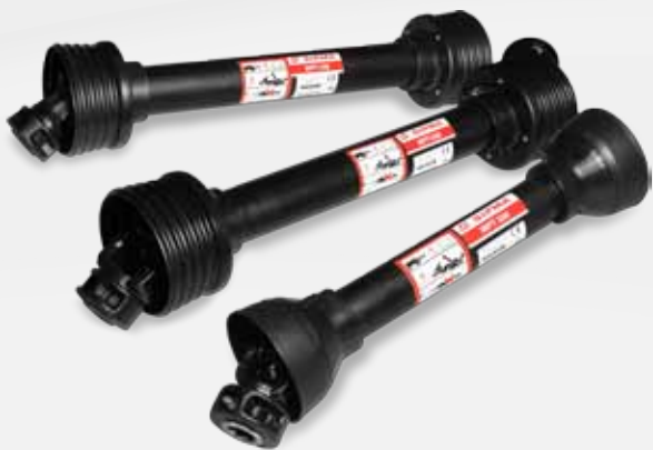
ARBRES DE TRANSMISSION DE BASE

SIPMA WPTS 300 SIPMA WPTS 680 SIPMA WPTS 900 SIPMA WPTS 1200