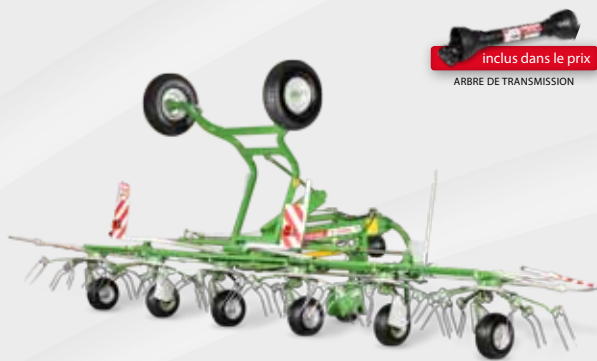
SIPMA PT 675 SALSA