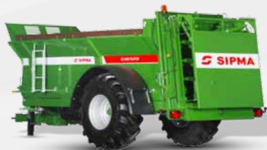
SIPMA RO 800 TAJFUN

Les épandeurs de fumier SIPMA RO 600 TAJFUN, SIPMA RO 800 TAJFUN et SIPMA RO 1000 TAJFUN sont utilisés pour l'épandage de fumier, de compost, de tourbe, de chaux et pour le transport de produits agricoles après avoir retiré l'adaptateur (pleinement compatibles avec les tracteurs équipés d'un attelage et entièrement adaptés au transport sur la voie publique).