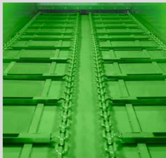
FOND MOUVANT DOUBLE

assurent la protection de l'adaptateur pendant le transport et ajustent la largeur d'étalement pendant le travail.