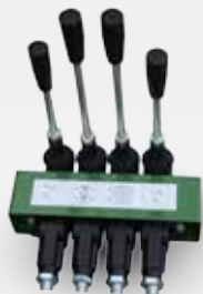
SYSTÈME DE LEVIER