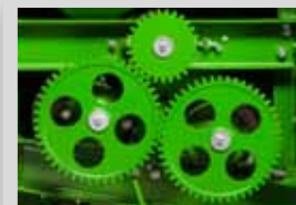
ENGINS (DE LA SÉRIE TYTAN)