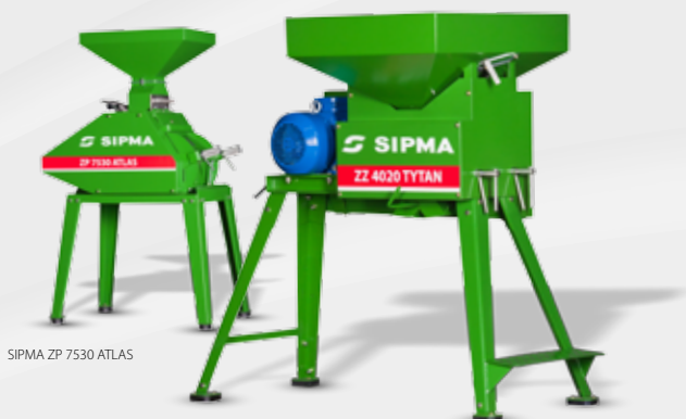
SIPMA ZP 7530 ATLAS

SIPMA ZZ 4020 TYTAN SIPMA ZZ 7520 TYTAN SIPMA ZZ 7530 TYTAN