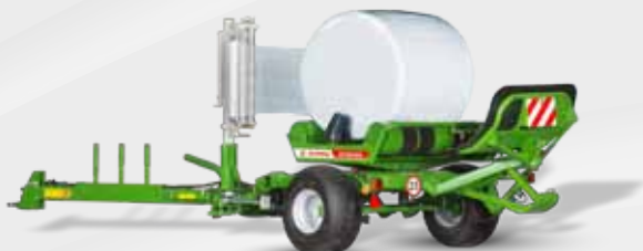
SIPMA OS 7650 GAJA

SIPMA OS 7530 MAJA SIPMA OS 7531 MAJA SIPMA OS 7650 GAJA SIPMA OR 7532 DIANA SIPMA OG 9750 LENA