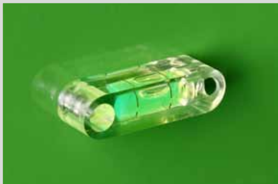
INDICATEUR D'INCLINAISON DE LA MACHINE

facilitent le positionnement de l'épandeur dans la bonne position par rapport au sol.