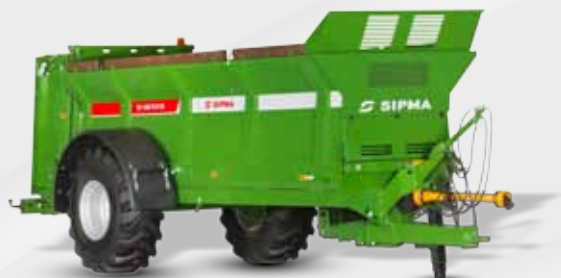
SIPMA RO 1000 TAJFUN