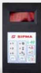
COMPTEUR DE BALLES

permet de contrôler l'emballage depuis la cabine du tracteur.