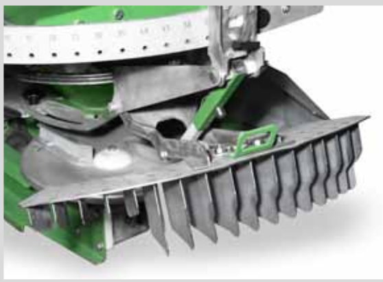
SYSTEME DE DÉTECTION DE BORDURES DE CHAMP

permet d'effectuer des travaux jusqu'aux bordures des champs conformément à la réglementation sur les engrais, tout en éliminant les pertes économiques résultant de la surfertilisation ou de l'épandage d'engrais dans les champs voisins. Fabriqué en acier inoxydable.