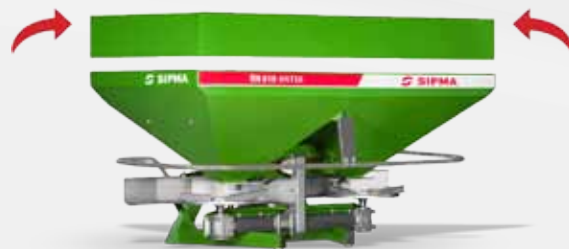
SIPMA RN 610 ANTEK AVEC REHAUSSES

peuvent être montées facilement sur la trémie principale et permettent d'ajuster la capacité de la trémie selon vos besoins, ce qui rend l'épandeur adaptable à une utilisation sur de petites et grandes surfaces. Assemblage simple, construction boulonnée, ce qui économise de l'espace de transport et réduit les frais de port.