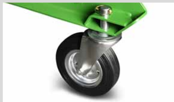
ROUE DE TRANSPORT

facilitant la déconnexion de l'épandeur et permettant de le manoeuvrer facilement. Équipé de freins.