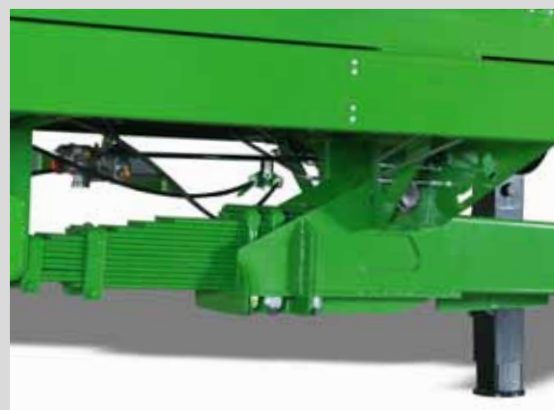
TIMON À RESSORTS

équipé de feuilles à ressort longitudinales garantit un grand confort d'usage.