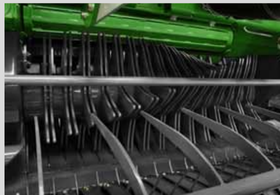
UNITÉ D'ALIMENTATION ET DE BROYAGE HAUTE

avec un système de plancher basculant, équipé de 15 couteaux de coupe, chacun avec une protection mécanique individuelle, garantit un flux rapide et efficace du matériau dans la chambre de compression. La longueur de coupe adaptée de 75 mm rend la matière idéale pour la formation de balles de fourrage vert compactées. La coupe de la matière récoltée rend les balles plus lourdes que les balles compactées sans coupe, ce qui augmente encore l'efficacité du transport des balles compactées.