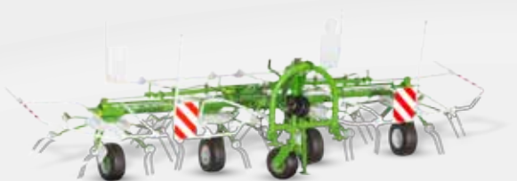
SIPMA PT 520 SALSA

SIPMA PT 520 SALSA et SIPMA PT 670 SALSA montés se caractérisent par une efficacité élevée, tout en garantissant une répartition optimale et égale du matériel fané.