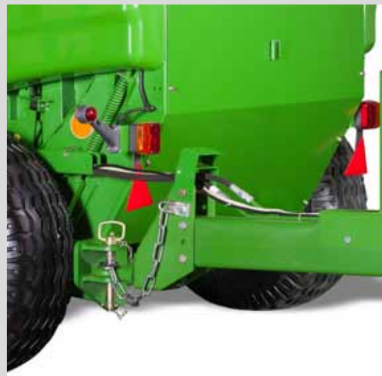
LE DISPOSITIF DE RACCORD

permet de le brancher aux enrubanneuses de balles SIPMA OS 7531 MAJA ou SIPMA OS 7650 GAJA. Grâce à cette fonctionnalité, la balle peut être formée et emballée en un seul fois, tout en économisant du temps et de l'argent.