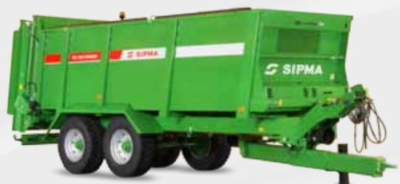
SIPMA RO 1200 TORNADO

Les épandeurs de fumier SIPMA RO 1200 TORNADO et SIPMA RO 1400 TORNADO pour épandre du fumier, du compost, de la tourbe et de la chaux à conception solide et une grande capacité de charge.