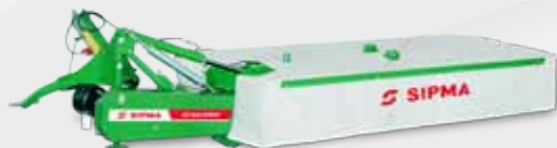
SIPMA KD 2620 SPRINT

Le SIPMA KD 2620 SPRINT et le SIPMA KD 3020 SPRINT équipés d'un système de fixation arrière à suspension latérale sont des machines modernes, légères et de conception simple.