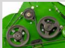
COURROIES EN V (DE LA SÉRIE ATLAS)