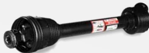
ARBRE DE TRANSMISSION À GRAND ANGLE

Les arbres à grand angle sont utilisés lorsque la position réciproque des prises de force et des arbres récepteurs peut provoquer l'articulation à 50° de travail continu et 80° de travail temporaire. Ces arbres permettent la transmission continue sans avoir besoin d'arrêter l'entraînement pendant les manœuvres en bout de parcelles.