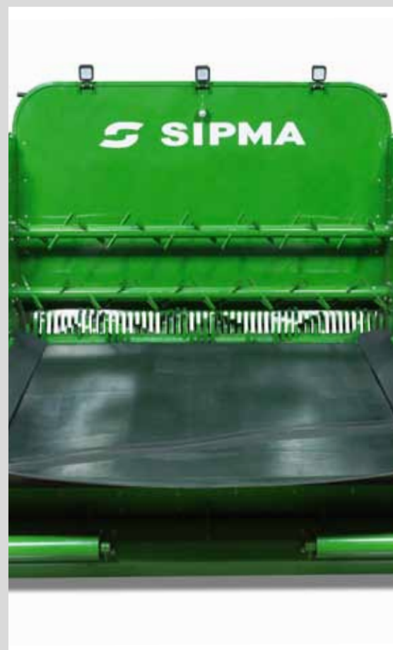
ALIMENTATEUR À COURROIE

qui commande tous les éléments mobiles de la machine assure le fonctionnement stable et optimale de la machine.