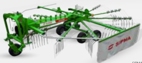
SIPMA ZK 450 WIR

Les andaineurs SIPMA ZK 350 WIR et SIPMA ZK 450 WIR sont conçus pour ratisser le fourrage vert, le fourrage séché, la paille et le foin.