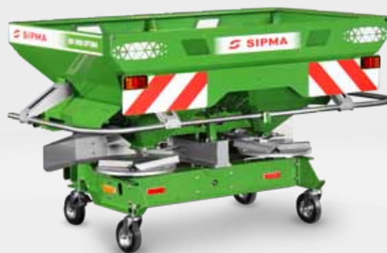
SIPMA RN 1000 OPTIMA

Les distributeurs d'engrais minéraux SIPMA RN 1000 OPTIMA et SIPMA RN 1000 OPTIMA PRO sont équipés de solutions de pointe pour un épandage d'engrais précis. Ils garantissent des performances élevées et répondent aux attentes des clients les plus exigeants.